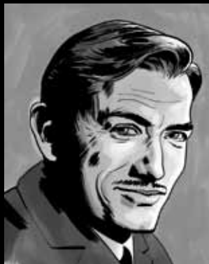
ERL RAT Šarmantni glavni glumac