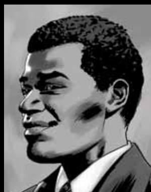
DŽEK PALAČINKA DŽONS Negdašnje dete-glumac