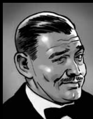
KLARK GEJBL „Iskreno, draga moja... baš me briga“