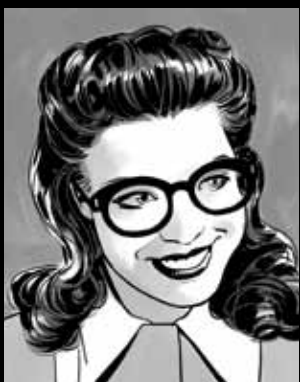
DOTI KVIN Studijska cura za odnose s javnošću