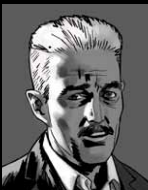
DAŠIJEL HAMET Čuveni krimi pisac