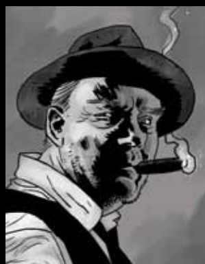
STIVI TARNER Fotograf zvezda