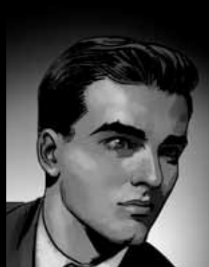
TAJLER GREJVS Holivudski lepotan